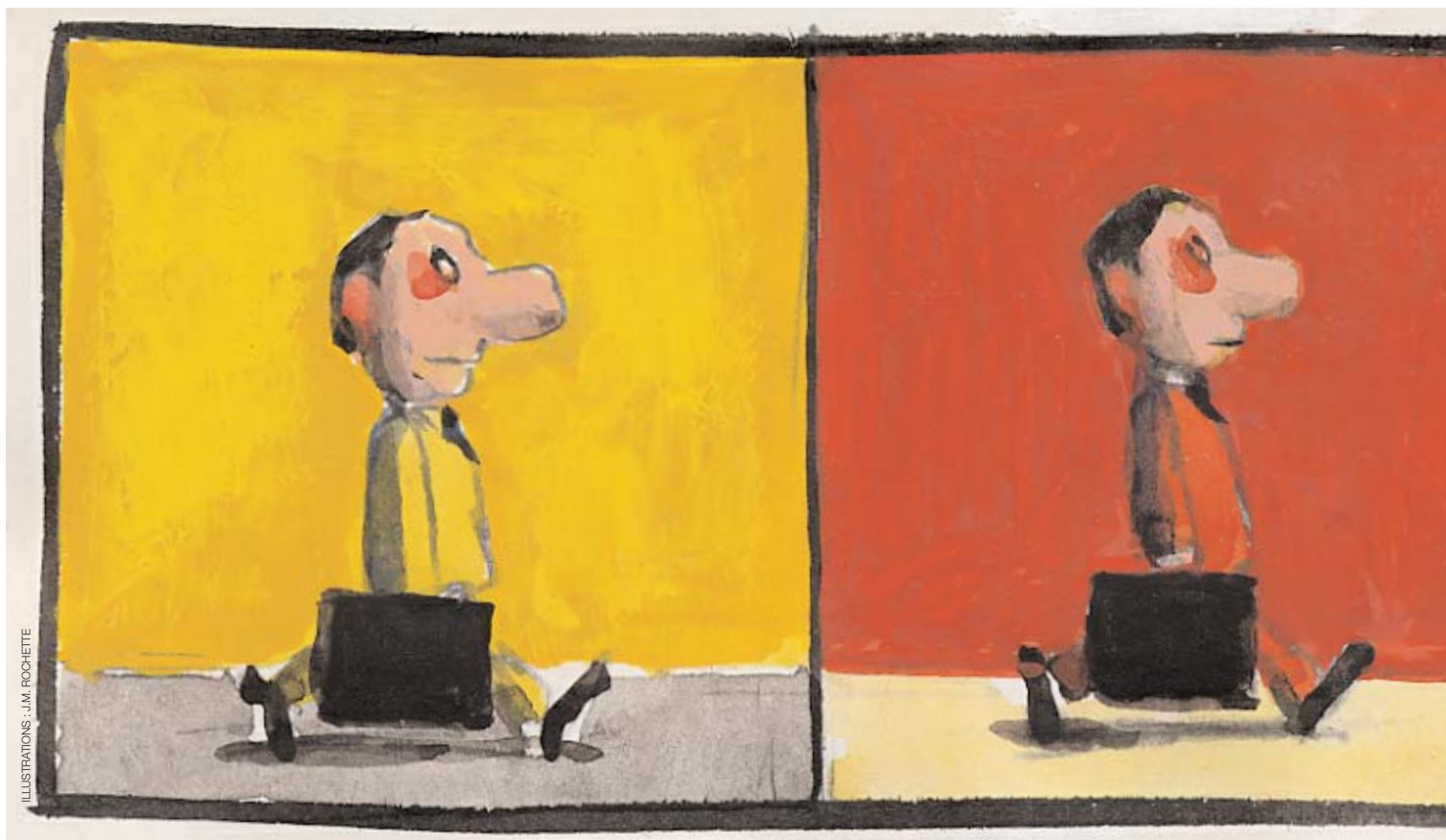
ILLUSTRATIONS : J.M. ROCHETTE